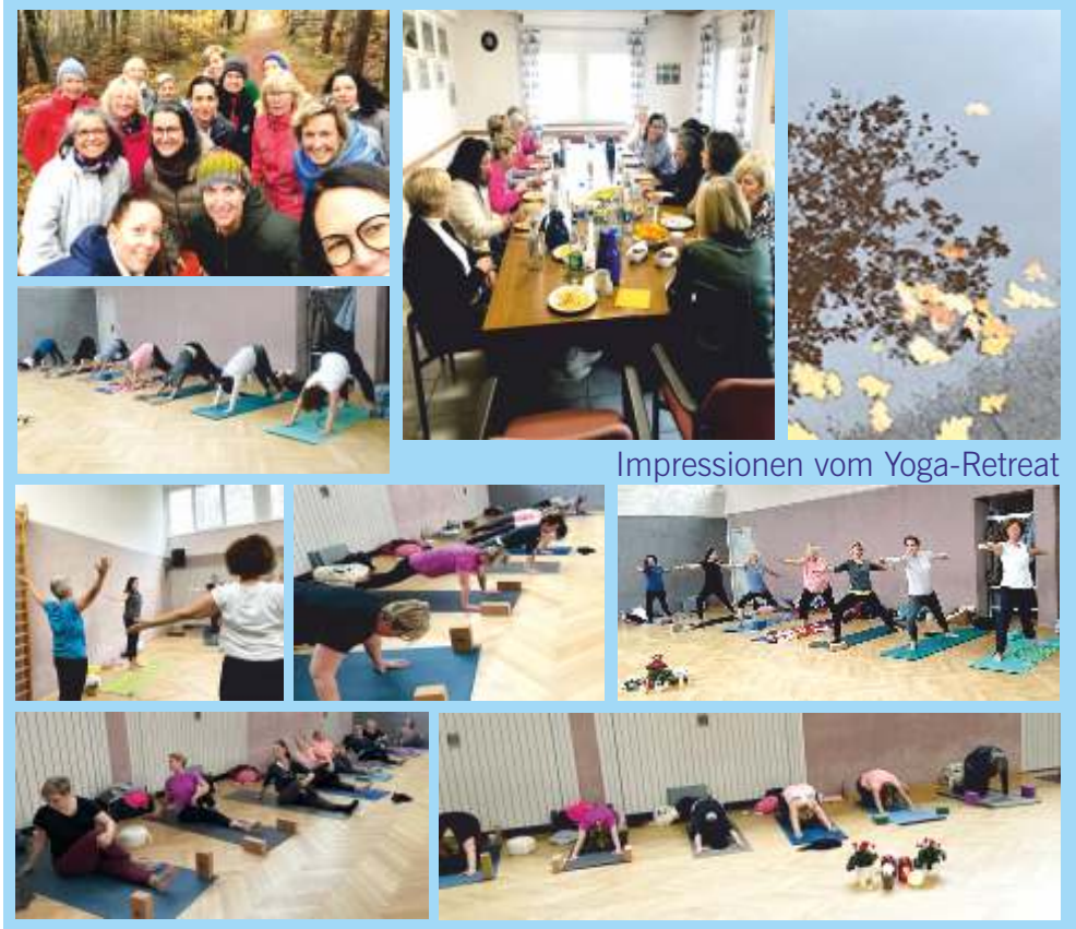
Impressionen vom Yoga-Retreat