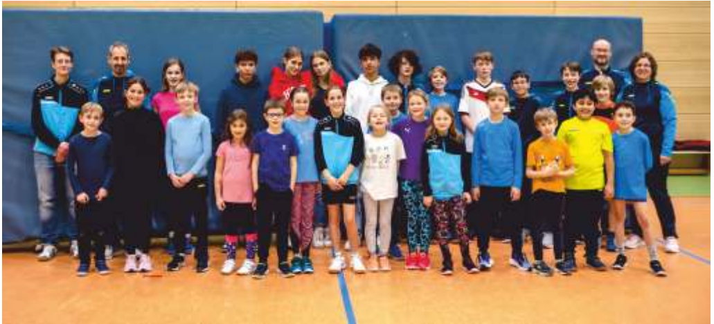
Jung, stark und begeisterungsfähig: Unser Leichtathletiknachwuchs!