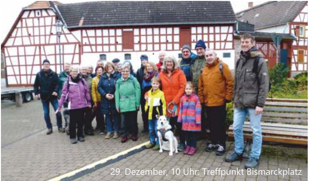
29. Dezember, 10 Uhr: Treffpunkt Bismarckplatz

„Monde und Jahre vergehen, aber ein schöner Moment leuchtet das Leben hindurch.“