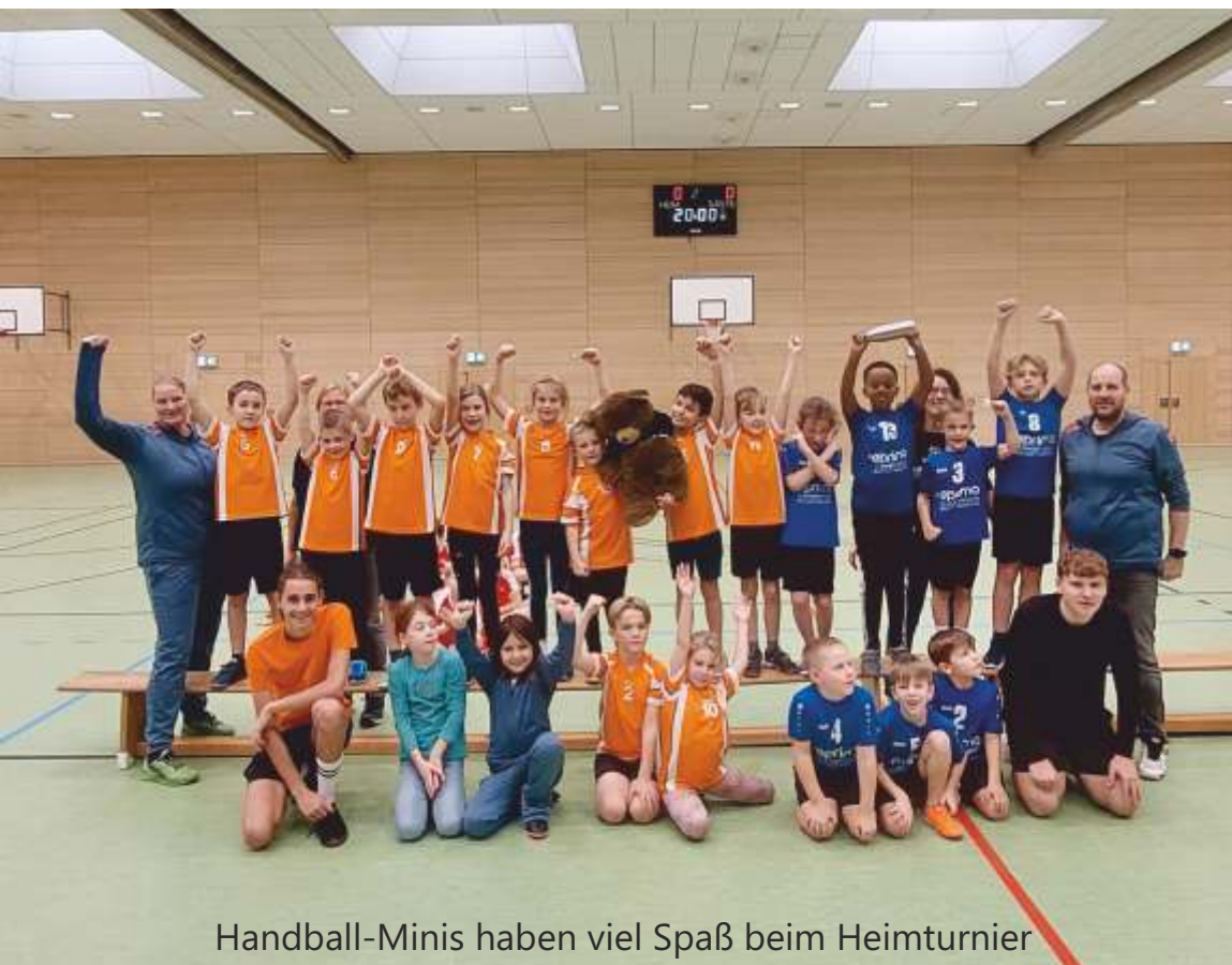
Handball-Minis haben viel Spaß beim Heimturnier