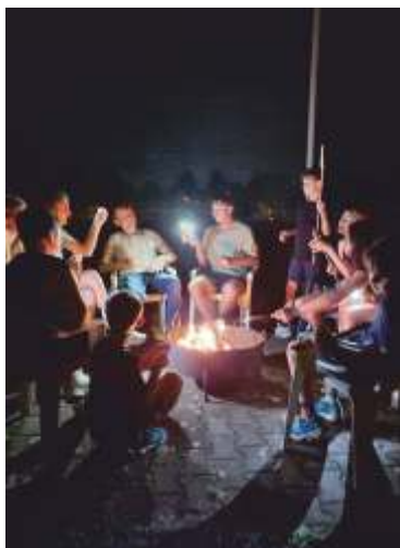
Stockbrot über dem Feuer