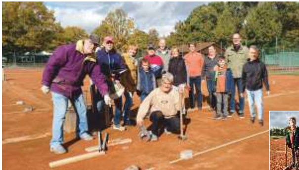
...so ausgerüstet geht es schnell!

"Wenn alles so einfach wäre, wie ihr sagt, wäre jeder die Nummer eins in unserem Sport."