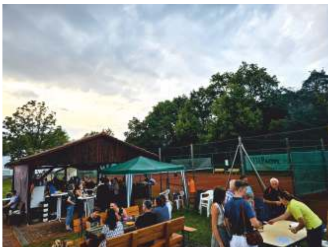
Trotz Äpfel-Notfall: Die Stimmung war prächtig!